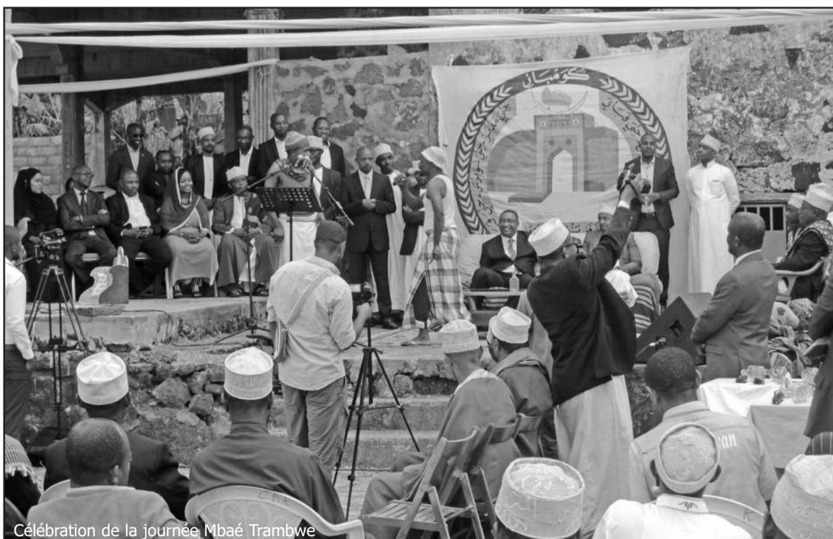
Célébration de la journée Mbae Trambwe

l'abonnement à La GAZETTE tellement plus simple Contact 322 76 45 ou 334 33 79