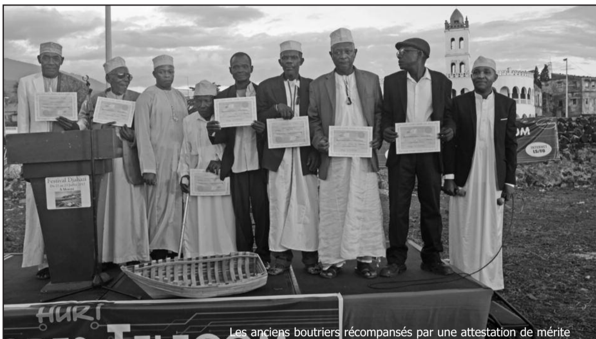
Les anciens boutriers récompensés par une attestation de mérite

Pour certaines personnes, cette première édition du Festival