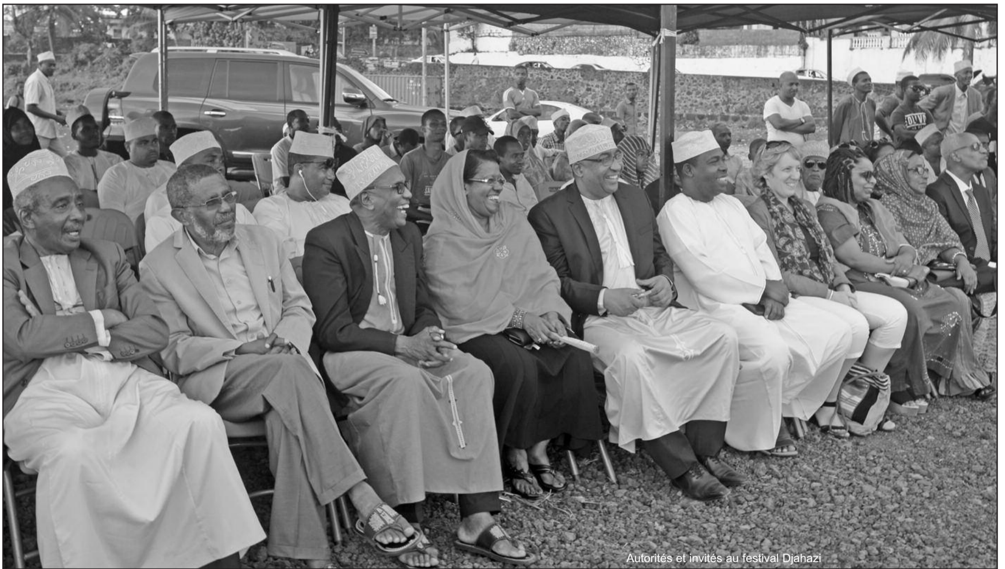
Autorités et invités au festival Djahazi